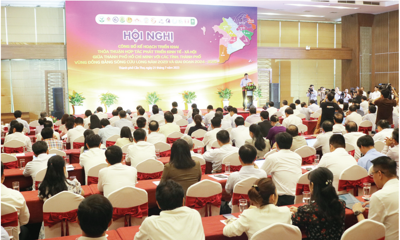
Toàn cảnh Hội nghị diễn ra tại Cần Thơ ngày 21/7/2023.