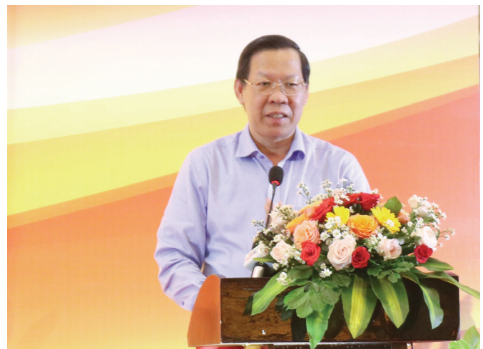
Đồng chí Phan Văn Mãi, Ủy viên Trung ương Đảng, Chủ tịch UBND TP. Hồ Chí Minh phát biểu tại Hội nghị.